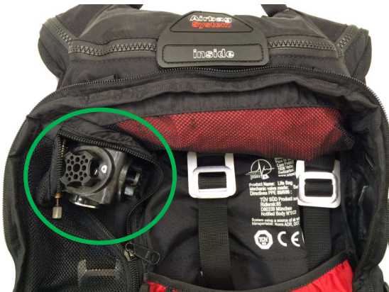
Hierbei handelt es sich um einen Lawinenairbag mit Inflation System 1.0