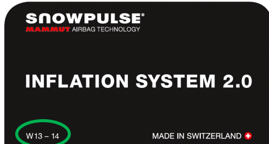
Hierbei handelt es sich um einen Lawinenairbag aus der Saison W13-14

➔ Sichtkontrolle muss NICHT durchgeführt werden !